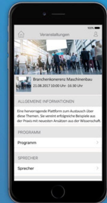
Detaileintrag einer Veranstaltung innerhalb der MultiEventApp 360