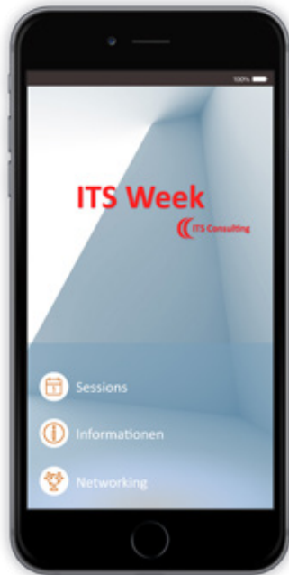
App-in-App: Eigenständige Event-App für eine Veranstaltung